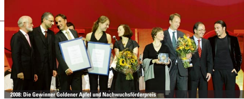
2008: Die Gewinner Goldener Apfel und Nachwuchsförderpreis

Mit dem „Goldenen Apfel“ kürt der BdP die beste Kommunikationsleistung des Jahres. Dabei handelt es sich um Aktionen der externen Kommunikation eines Unternehmens, eines Verbands, einer öffentlichen Institution oder weiterer Organisationen. Die