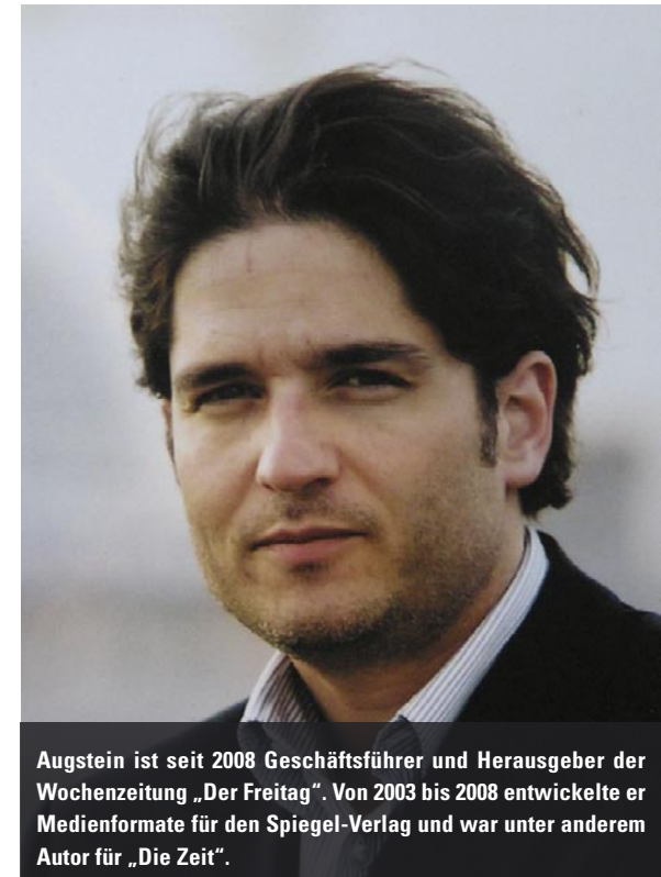
Augstein ist seit 2008 Geschäftsführer und Herausgeber der Wochenzeitung „Der Freitag“. Von 2003 bis 2008 entwickelte er Medienformate für den Spiegel-Verlag und war unter anderem Autor für „Die Zeit“.