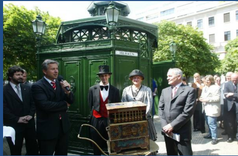
Einweihung Café Achteck Klaus Wowereit, Regierender Bürgermeister von Berlin Gendarmenmarkt in Berlin, 11.06.2003